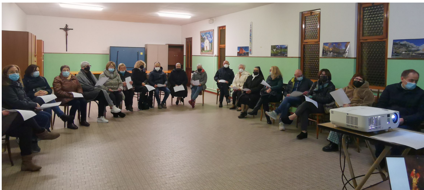
Uno degli incontri tenutisi nelle diverse parrocchie durante la Quaresima: in questo caso, nella sala parrocchiale di Variano.