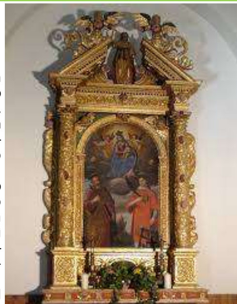
Ecco come poteva essere l'altare incendiato il 13.04.1525

La straordinarietà del fatto giunse a conoscenza del patriarca di Aquileia, il