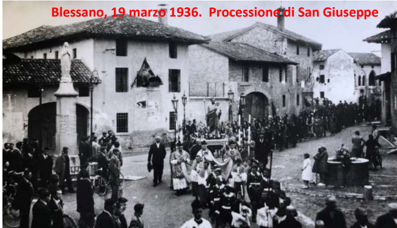
Blessano, 19 marzo 1936. Processione di San Giuseppe

Sono dati numerici "freddi", che dicono poco dal punto di vista statistico, ma forse ci permettono di comprendere la povertà, la malattia, il disagio sociale e familiare, le lotte e i sacrifici dei nostri compaesani così tartassati dalla morte, che sempre incombeva.