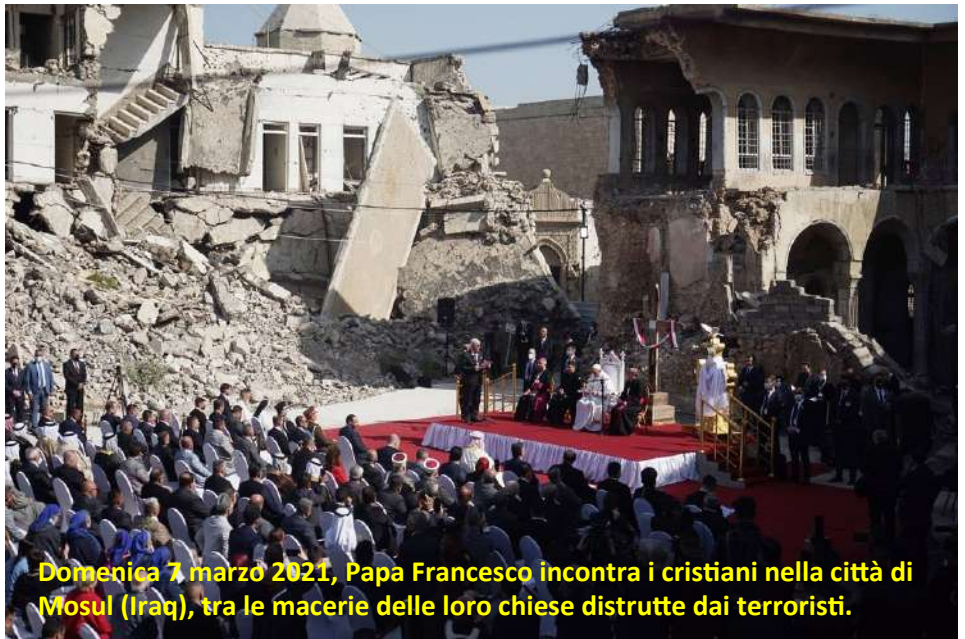
Domenica 7 marzo 2021, Papa Francesco incontra i cristiani nella città di Mosul (Iraq), tra le macerie delle loro chiese distrutte dai terroristi.