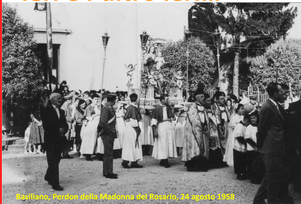
Basiliano, Perdon della Madonna del Rosario, 24 agosto 1958