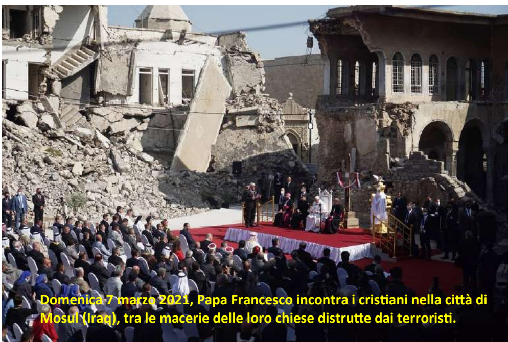
Domenica 7 marzo 2021, Papa Francesco incontra i cristiani nella città di Mosul (Iraq), tra le macerie delle loro chiese distrutte dai terroristi.