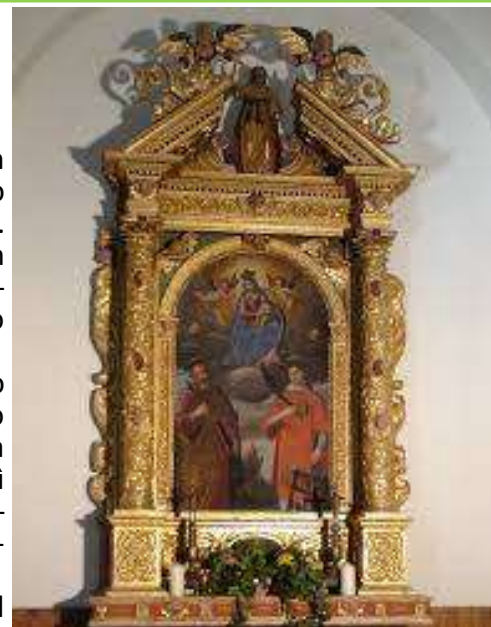
Ecco come poteva essere l'altare incendiato il 13.04.1525

La straordinarietà del fatto giunse a conoscenza del patriarca di Aquileia, il