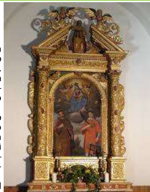
Ecco come poteva essere l'altare incendiato il 13.04.1525

La straordinarietà del fatto giunse a conoscenza del patriarca di Aquileia, il