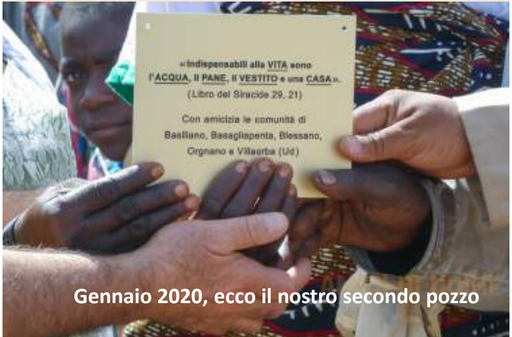
Gennaio 2020, ecco il nostro secondo pozzo