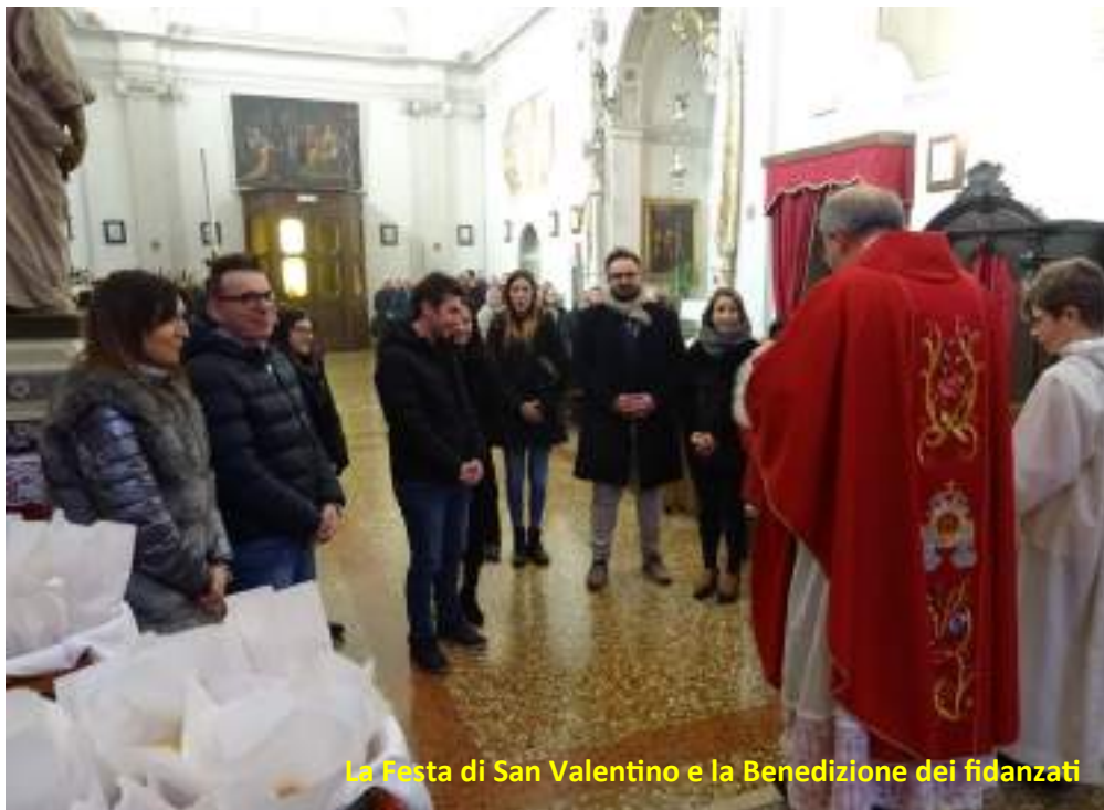
La Festa di San Valentino e la Benedizione dei fidanzati

Lazzaro di Betania, morto per una malattia e risuscitato da Gesù dopo quattro giorni, il figlio di una vedova della cittadina di Nain, e la figlia di Giairo, notabile di Cafarnaon, risuscitati sempre da Gesù. Troviamo i racconti rispettivamente nel Vangelo di Giovanni al capitolo 11 versetti da 1 a 44, nel “Vangelo di Luca al capitolo 7 versetti da 11 a 16” e nel Vangelo di Marco al capitolo 5 versetti da 22 a 43. Da questi fatti ci accorgiamo che il nostro Dio è un Dio che risuscita i morti.