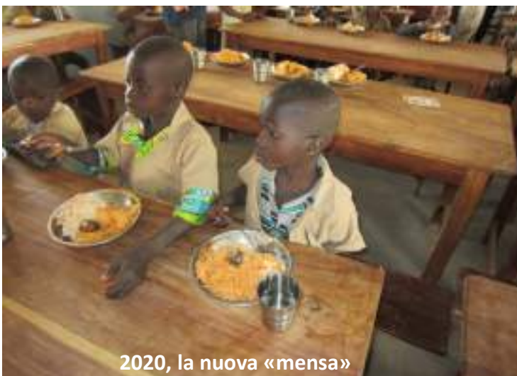
2020, la nuova «mensa»