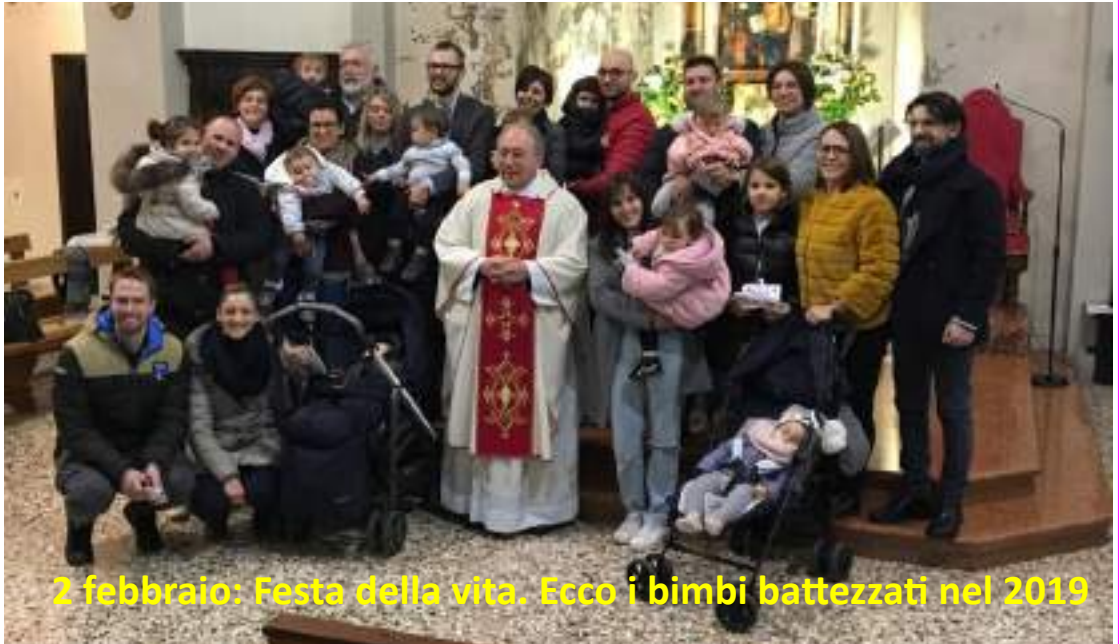
2 febbraio: Festa della vita. Ecco i bimbi battezzati nel 2019

Il feto, fragile e minuscolo, suscita interesse: scienziati, ostetrici e psicologi hanno da tempo dimostrato che si tratta di un essere i cui cromosomi portano l'impronta di un individuo distinto e non confuso con la madre. La sensibilità del feto, la sua memoria, il suo sistema nervoso... tutto questo esiste e funziona allo stato puro. È altro dalla madre, ma - allo stesso tempo - totalmente dipendente da lei, dalle sue migliori impres-