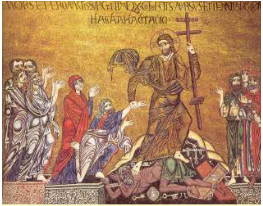
Ecco il mosaico della Basilica di Torcello (Ve): il Risorto, su cui si riconoscono i segni della Passione, con la sua croce in mano, libera Adamo, Eva e ogni altro uomo, prima e dopo di loro; schiacciato è l'autore della disobbedienza.

Un soldato romano, per verificare la sua morte ed assicurare tutti che Gesù è veramente morto, lo colpisce al cuore con una lancia e subito esce sangue e acqua. Giuseppe d'Arimatea, membro del Sinedrio, chiede a Pilato il corpo di Gesù, lo avvolge con un telo sindonico (la Sindone) e lo pone in un sepolcro nuovo scavato nella roccia. La Sindone custodita nel Duomo di Torino è lenzuolo di lino (4,36 x 1,1 metri), sulla quale vi sono ancora oggi le macchie di sangue di Gesù, che testimoniano le torture che dovette subire, e l'impronta (anteriore e posteriore) in negativo di Gesù Crocifisso, impressionata sul telo come se fosse il negativo di una fotografia, sulla cui origine misteriosa gli scienziati di tutto il mondo stanno ancora studiando. Questo attesta che Gesù è morto realmente. Mediante la sua morte, Gesù ha vinto la morte stessa e il diavolo "che ha il potere della morte" afferma la Lettera agli Ebrei (2,14). Gesù Cristo morto è disceso nella dimora dei morti ed ha aperto le porte del cielo ai giusti che l'avevano preceduto e che aspettavano la redenzione.