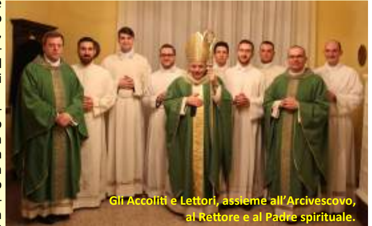
Gli Accoliti e Lettori, assieme all'Arcivescovo, al Rettore e al Padre spirituale.