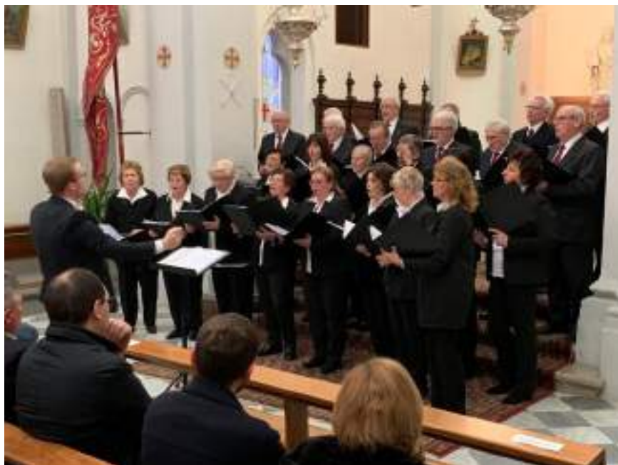
Il coro "Vos di Muzane" di Muzzana