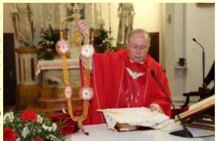
Benedizione della corona, dono delle suore del Talmil Nadu.

D a anni la nostra Parrocchia sostiene il progetto missionario a favore degli ammalati, dei bambini da istruire, della promozione della donna nello Stato "TALMIL NADU" in India. Il progetto è realizzato dalle Suore Dimesse. Siamo tutti chiamati, ciascuno secondo le sue possibilità, a dare un aiuto. L'offerta può essere fatta in Chiesa nell'apposita CASSETTA (fino alla fine di maggio) o con versamento sul conto della Parrocchia con la motivazione "PROGETTO TALMIL-NADU". La raccolta fondi è iniziata con la vendita dei biscotti preparati dalle parrocchiane avvenuta dopo la processione con S. Valentino.