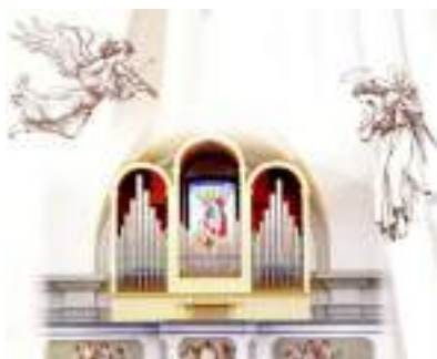
La Corale "Gelindo Petris" di Vissandone