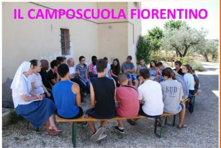
IL CAMPOSCUOLA FIORENTINO

Il tema della settimana è stato la BELLEZZA, nelle sue diverse sfaccettature: quella dei luoghi artistico-culturali di Firenze, quella del lavoro manuale gratuito, quella della vita fraterna e semplice e infine LA BELLEZZA DELLA VITA CHE DIO PADRE CI HA DONATO PER AMORE. Di grande valore è sta-