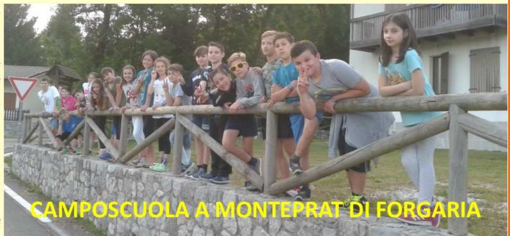
CAMPOSCUOLA A MONTEPRAT DI FORGARIA