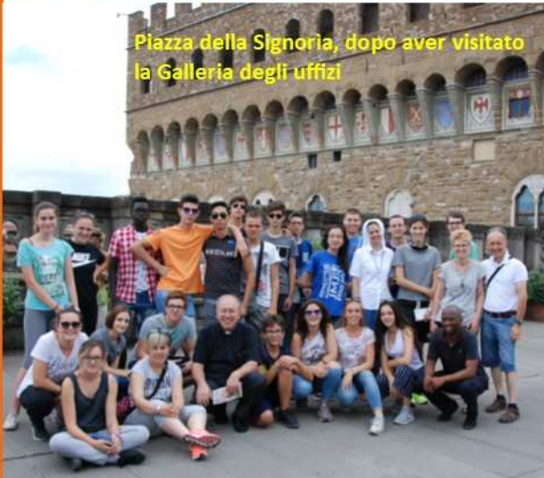
Piazza della Signoria, dopo aver visitato la Galleria degli uffizi