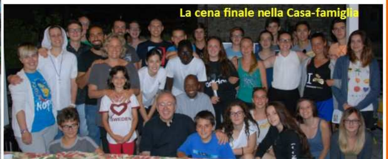
La cena finale nella Casa-famiglia