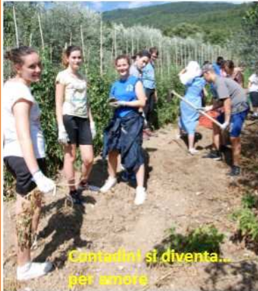
Contadini si diventa... per amore

“Non è bello ciò che è bello.....è bello ciò che c'è!” questo è il titolo della settimana di camposcuola vissuta quest'estate a Sesto Fiorentino (Fi) dai nostri giovani di 14-23 anni. Noi educatori abbiamo voluto fortemente che anche loro avessero la loro opportunità di crescita umano-spirituale, dopo aver prestato il loro prezioso servizio come animatori delle quattro settimane di oratorio. Questo perché per poter donare è necessario ricevere, come quando si va alla fonte per rifornirsi di acqua.