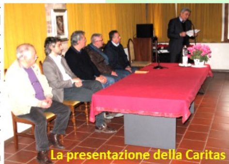
La presentazione della Caritas