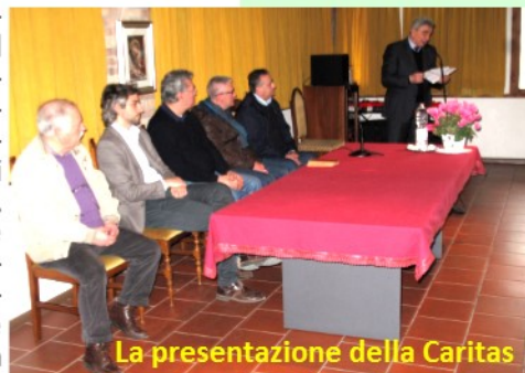
La presentazione della Caritas