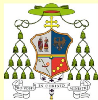
Lo stemma episcopale del Pastore della nostra Arcidiocesi, che troviamo all'ingresso delle nostre chiese parrocchiali.