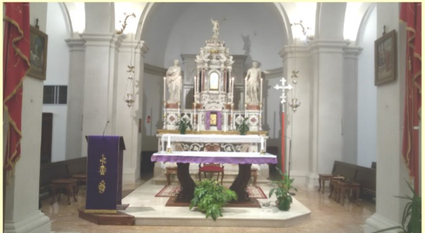
L'altare maggiore della nostra chiesa parrocchiale, sempre curato.