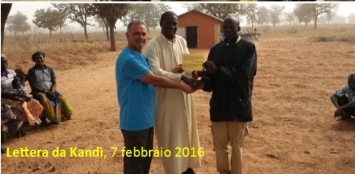
Lettera da Kandì, 7 febbraio 2016

Cari benefattori, le parole giuste ci mancano per esprimere ad ognuno di voi la gratitudine che scaturisce dal nostro cuore. Quanti sacrifici fate per dare un futuro sicuro e pieno di speranza ai bimbi dei nostri villaggi, cercando sempre di dare a loro un'istruzione di qualità. Non vi siete mai stancati di donare acqua a tanta gente che non ne ha e faceva parecchi chilometri per trovarne un po', anche se non pulita.