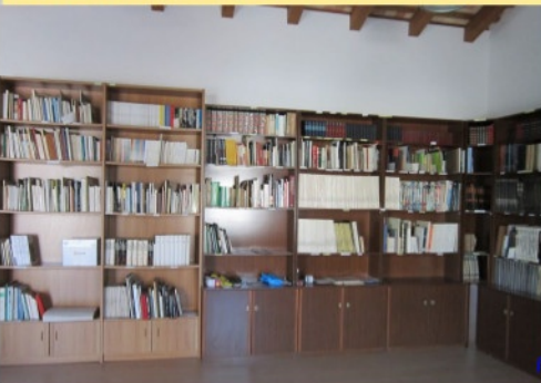
ripiani della biblioteca con i libri già catalogati