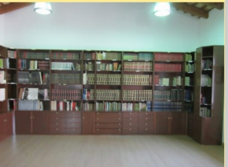
La targa che ricorda don Angelo Tam e la biblioteca nel cortile interno della Casa della Gioventù.