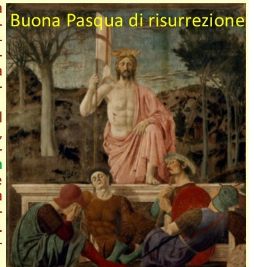
Buona Pasqua di risurrezione